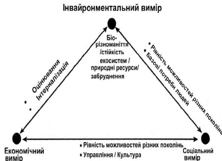
Рис. 1. Три виміри в концептуальних рамках сучасної парадигми сталого розвитку

Саме на міждисциплінарному підході робився наголос одним із авторів цієї статті, визначаючи, що з формальної точки зору сталий розвиток має розглядатися як гармонізація співвідношень трьох підсистем системи цивілізації – соціуму, економіки і довкілля, а відповідне ілюстративне подання пояснювало домінуюче положення соціального виміру [13, С. 101] на відміну від рис. 1, де його місце займає інвайронментальний вимір.