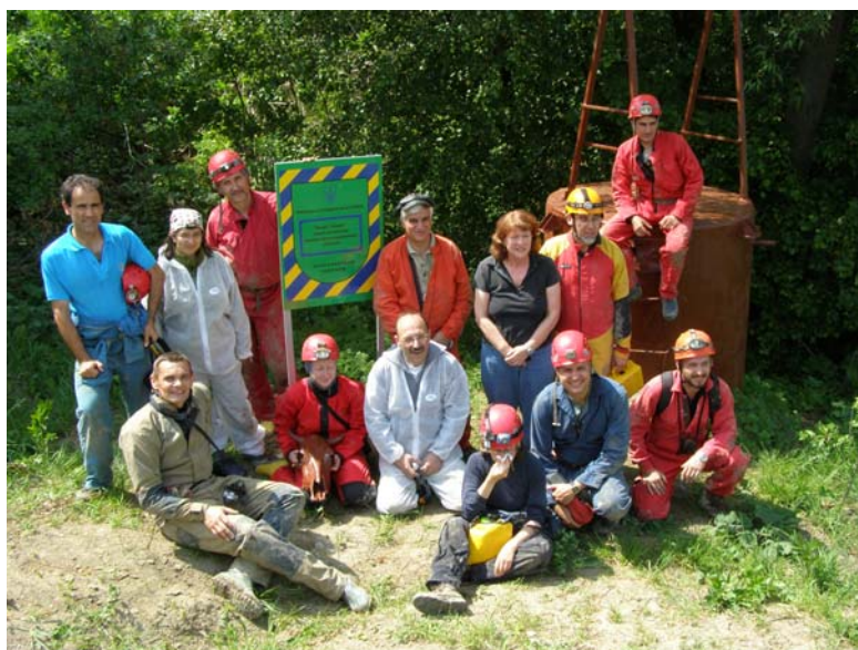
Рис.3. Участники полевой экскурсии у входа в пещеру Озерная

В заключительные дни конференции был проведен ряд полевых экскурсий по Западно-украинскому региону гипсового карста, который является признанным мировым эталоном гипогенного спелеогенеза. Запланированные полевые экскурсии по Буковине, Приднестровской Подолии и Покутью дали участникам уникальную возможность ознакомиться с набором эволюционных типов карста и крупнейшими в мире гипсовыми пещерами-лабиринтами Кристальной, Юбилейной, Золушкой, Озерной и Оптимистической (рис.3). Это явилось хорошей иллюстрацией научных и практических проблем гипогенного спелеогенеза, гидрогеологии карста артезианских бассейнов и инженерной геологии покрытого карста.