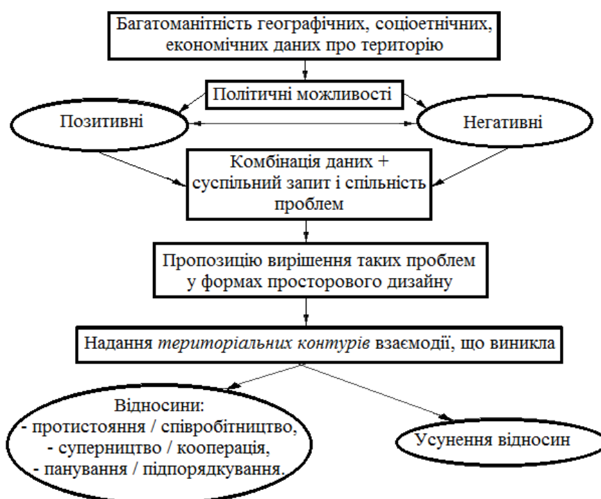
Рис.2. Схема інтерпретації геополітики в якості «техніки політичного проектування» (складено за [10])

Такий підхід знімає дискусію між класичною і модерною геополітикою, оскільки дозволяє перетворити будь-який фактор на фактор геополітичний, «тобто такий, що може забезпечити перетворення географічного об'єкта на певну привабливу політичну програму, надавши простору якості «ставки»(Р. Арон)». Так, «економічні чинники і стають геоекономічними, суто територіальні (простір як театр, за Р. Ароном) – геостратегічними, культурні – геокультурними, історичні – геоісторичними і так далі» [10].